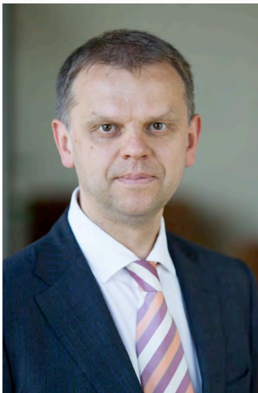
Lietuvos ambasadorius Jungtinės Tautos – Ženevoje